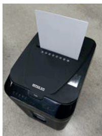
2. Вставьте бумагу в слот подачи