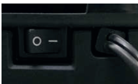
1. Включите shredder