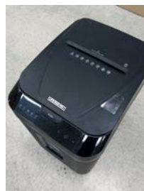
4. Закройте крышку, чтобы начать работу