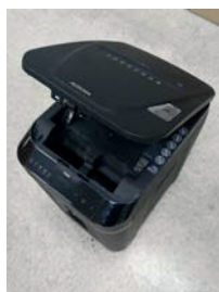
2. Откройте крышку