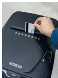
3. Пластиковые карты опускайте строго в центр слота