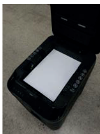
3. Добавьте бумагу